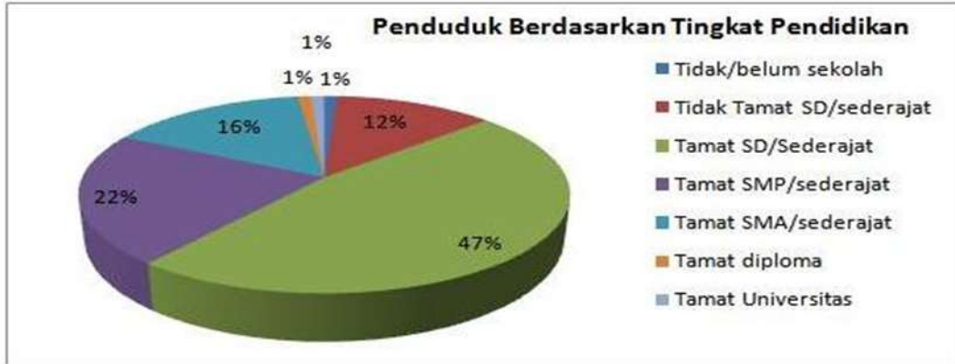
Gambar 1.1 Data Penduduk Berdasarkan Tingkat Pendidikan

didik secara aktif mengembangkan potensi dirinya untuk memiliki kekuatan spiritual keagamaan, pengendalian diri, kepribadian, kecerdasan, akhlak mulia, serta keterampilan yang diperlukan dirinya, masyarakat, bangsa dan negara. Tujuan pendidikan nasional secara tegas menekankan pentingnya pembentukan akhlak al-karimah yang diimplemetasikan dengan keimanan dan ketaqwaan sebagai aspek penting dalam pembentukan karakter anak bangsa.